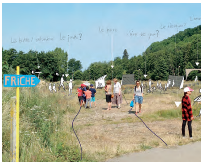
Résidence de Pont-Audemer 2017

Durant leur temps de résidence, l'architecte et son binôme sont invités à rendre visible ce qui est là, à révéler des potentiels, des opportunités . Il ne s'agit pas de concevoir un projet, mais plutôt de produire une pensée, un récit, et de les partager avec ceux qui vivent ici. A l'issue de la résidence, une restitution de la démarche est organisée, donnant lieu à un temps fort, convivial, un moment de valorisation et de rencontre ouvert à tous.