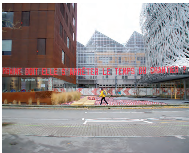
Résidence métropolitaine internationale d'architectes Nantes > Montréal - 2016