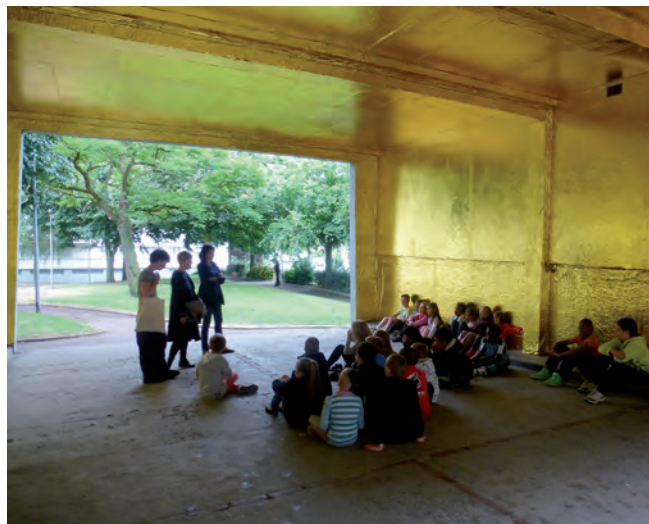
Laboratoire des territoires - Caen 2014