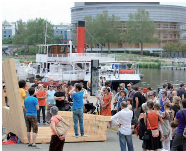
Révéler la ville #4 © Ardepa

Dans cette perspective, il sera demandé aux résidents de produire une courte vidéo (entre 5 et 10 minutes) présentant leur démarche et leurs réalisations dans le cadre de leur résidence et de mettre à disposition du Réseau des Maisons de l'architecture tous les documents nécessaires.